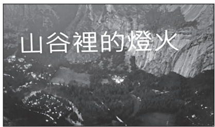
美國民謠《山谷裡的燈火》是臺灣國中的音樂教材。