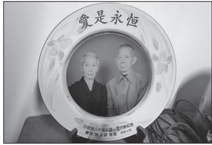
父母親對子女的愛永恆不變。