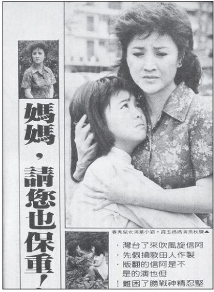
華視連續劇《媽媽請您也保重》宣傳照

母親節，聚餐、買禮物人潮不斷，政府也表揚模範母親表達敬意。在現代社會，也有男性擔任母親角色，「臺灣家扶基金會」表揚全國模範母親，受獎者有：曾祖母、阿嬤、父親、姊姊、姑姑兼代母職，他們無私的愛心，重新定義了母親一詞，正是愛與承擔的合體！也有單親家庭，父兼母職獲獎，男性也獲選模範母親，顯示時代改變，臺灣兩性平等。